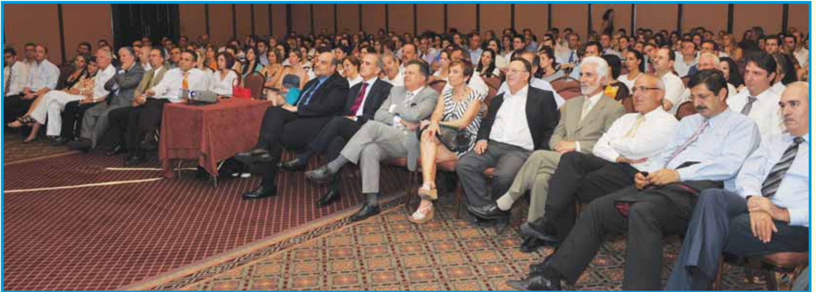
Οι παρευρισκομένοι παρακολουθούν με ενδιαφέρον το θέμα της διάλεξης