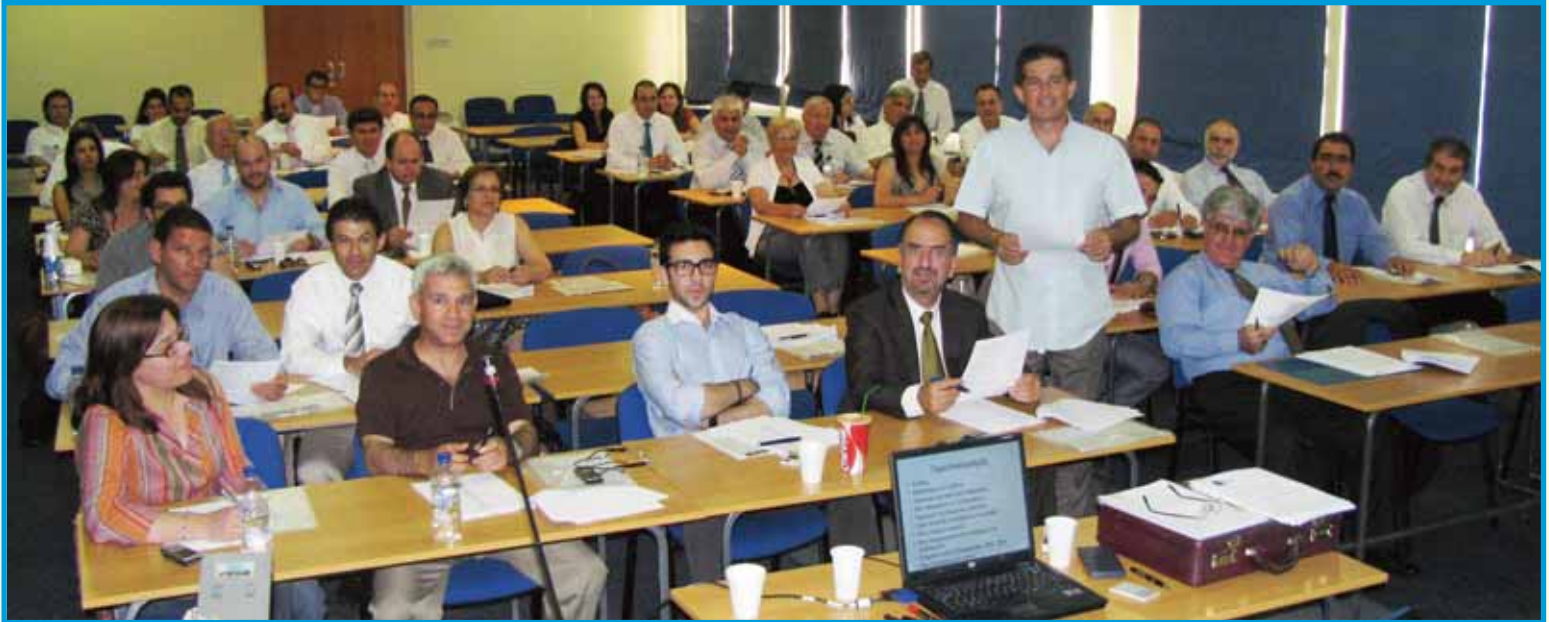
Στιγμιότυπα από το σεμινάριο

ΕΝΗΜΕΡΩΤΙΚΗ ΕΚΔΟΣΗ ΤΟΥ ΑΣΦΑΛΙΣΤΙΚΟΥ ΙΝΣΤΙΤΟΥΤΟΥ ΚΥΠΡΟΥ ❖ ΤΕΥΧΗ 25 - 26 ❖ ΙΑΝΟΥΑΡΙΟΣ - ΙΟΥΛΙΟΣ 2010