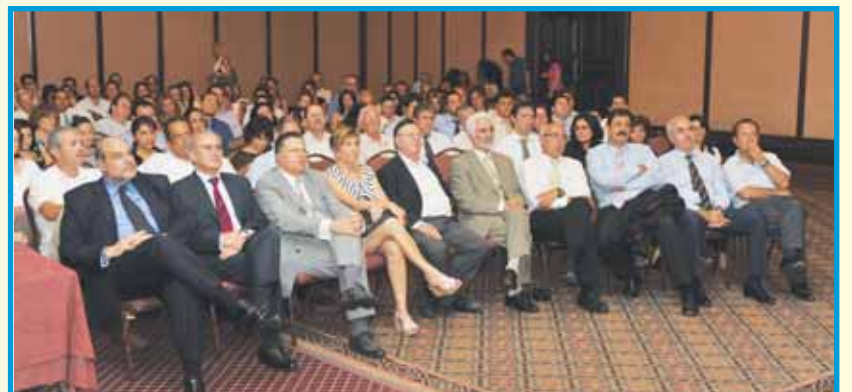
Σημιότυπα από την διάλεξη