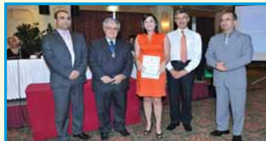
Καίτη Συνέση Λαϊκή Ασφαλιστική

Για την καλύτερη επίδοση στις Εξετάσεις Νομικές Πτυχές της Ασφάλισης απονεμήθηκε στην: