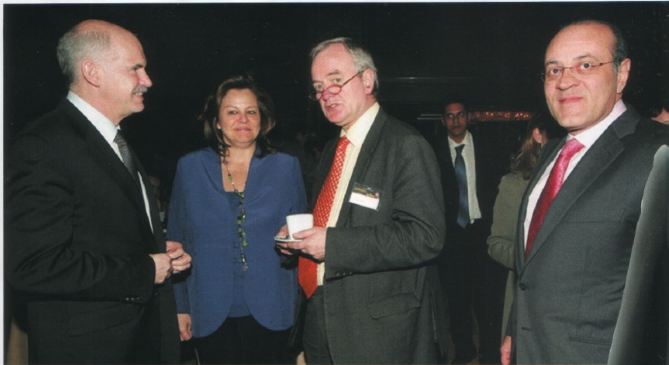
Το Μάρτιο του 2009, πριν ακόμα δηλαδή ξεσπάσει η μεγάλη οικονομική κρίση, ο επικεφαλής της οικογένειας Ντέιβιντ ντε Ρότσιλντ επισκέφτηκε την Ελλάδα και είχε επαφές με τον τότε πρωθυπουργό Κώστα Καραμανλή όσο και με τον πρώην πρωθυπουργό Γιώργο Α. Παπανδρέου, αλλά και με Έλληνες τραπεζίτες

► Το πέπλο αυτού του μυστηρίου ρίχνει μεγαλύτερη σκιά αν συνοπολογίσει κανείς ότι η ΤτΕ είναι ένας εκ των εταίρων που υπογράφουν και τις δύο ληστρικές δανειακές συμβάσεις με τους δανειστές μας και μάλιστα ως αντιπρόσωπος του ελληνικού δημοσίου. Το ερώτημα προφανές: Πώς είναι δυνατόν μια τράπεζα που δεν ελέγχει το ελληνικό δημόσιο να υπογράφει ως αντιπρόσωπός του;