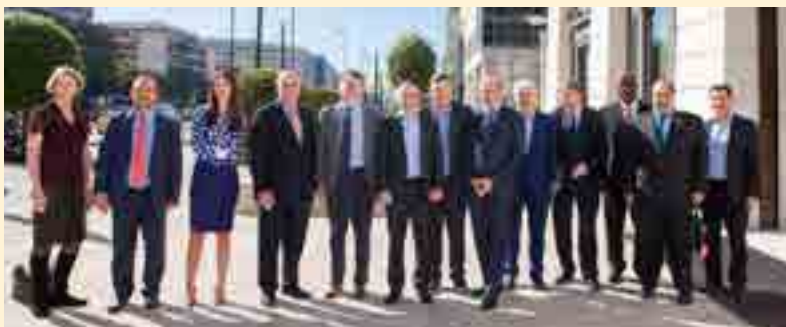
Στιγμιότυπο με τα μέλη του Δ. Σ. του International Federation of Health Plans, στα κεντρικά γραφεία της Interamerican

Την ίδια ώρα, μια σημαντική διεθνής σύσκεψη κορυφαίων εκπροσώπων του τομέα της ασφάλισης υγείας φιλοξένησαν στην Αθήνα, πρόσφατα, η Interamerican και η Achmea. Ήταν η τακτική, ετήσια συνάντηση εργασίας του διοικητικού συμβουλίου του International Federation of Health Plans (IFHP), που αποτελεί παγκοσμίως το κορυφαίο forum εταιρειών ασφάλισης υγείας και από τις εργασίες του προέκυψε το συμπέρασμα ότι υφίστανται σημαντικές προοπτικές ανάπτυξης του ιδιωτικού τομέα υγείας στην Ελλάδα σε ένα σχέδιο συνεργασίας με το δημόσιο σύστημα, που θα μπορούσαν να δώσουν ουσιαστικές λύσεις, ανακουφίζοντας την εθνική οικονομία και δημιουργώντας κοινωνική αξία με προσιτές και επαρκείς παροχές ασφάλισης και υπηρεσιών. Προς αυτή την κατεύθυνση, τα μέλη του IFHP δήλωσαν πρόθυμα να συμβάλουν με προτάσεις και πρωτοβουλίες. Στο IFHP συμμετέχουν 100 εταιρείες, που κατέχουν ηγετική θέση στον τομέα στις χώρες τους. Η Interamerican, ως η μοναδική από τη χώρα μας εταιρεία και η Achmea, συμπεριλαμβάνονται στο forum και συμμετέχουν ενεργά στην επικαιροποίηση του προβληματισμού και τη