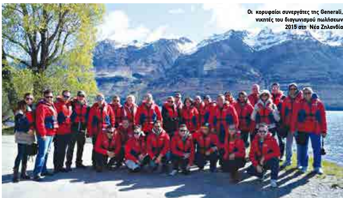
Οι κορυφαίοι συνεργάτες της Generali, νικητές του διαγωνισμού πωλήσεων 2015 στη Νέα Ζηλανδία

Η Νέα Ζηλανδία μάγεψε τους 65 συμμετέχοντες με το ανεπανάληπτο φυσικό της τοπίο. Η περιπέτεια ξεκίνησε από την Αθήνα, με ενδιάμεση στάση