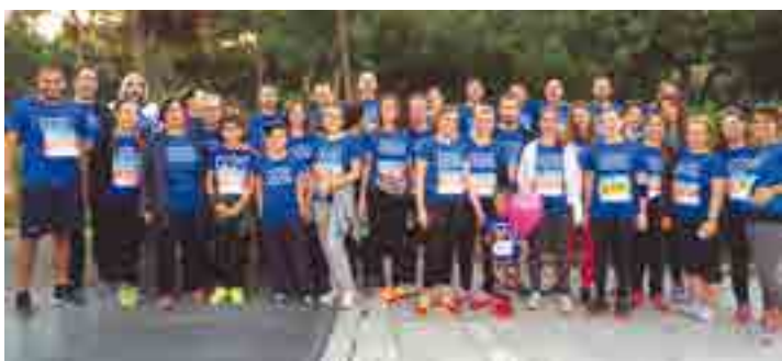
Η AIG Running Team που συμμετείχε στον αγώνα των 5 χλμ.

Παράλληλα, η AIG αποφάσισε να ενισχύσει χρηματικά την «Κιβωτού του Κόσμου» για τρίτη συνεχόμενη χρονιά αναγνωρίζοντας με αυτό τον